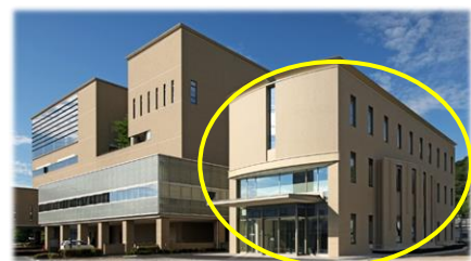
当センターは、姫路市医師会館西館1階にあります。

医療・介護関係者の不安やお悩みへの相談窓口の運営をはじめ、地域の医療・介護に関する情報提供、各種研修会の開催などを通じて、医療と介護の架け橋となれるよう業務を行ってまいりますので、是非、ご利用いただきますようよろしくお願い申し上げます。