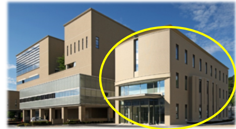
当センターは、姫路市医師会館西館1階にあります。

医療・介護関係者の不安やお悩みへの相談窓口の運営をはじめ、地域の医療・介護に関する情報提供、各種研修会の開催などを通じて、医療と介護の架け橋となれるよう業務を行ってまいりますので、是非、ご利用いただきますようよろしくお願い申し上げます。